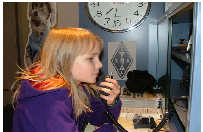
Kuva: 800 koululaista ja opettajaa sai ensituntuman radioamatööritoimintaan kerhon koululaisesittelyissä

Lahden kaupungin koulutoimi päätti, että kaupungin kaikkien peruskoulujen 4.-luokkalaisten tulee vierailla Radio- ja tv-museolla osana koulun kulttuurikasvatusta. Kerholle tarjoutui tilaisuus antaa apua museolle esittelemällä radioamatööritoimintaa OH3R:n asemalla.