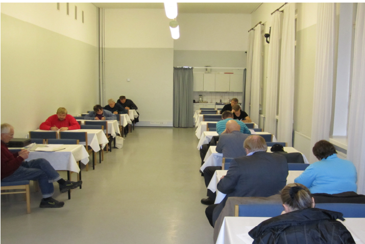
Kuva: Tutkinnot järjestettiin Museon vanhan rakennuksen juhlasalissa,

K-moduulin tutkinto pidettiin kurssin alkuosassa (12.10.2010) ja lopussa (16.11.2010). T1-tutkinto pidettiin kahdesti, 16.11.2010 ja 7.12.2010 Tutkintoja suoritettiin yhteensä 14 kpl, joista yksi yleisluokkaan.